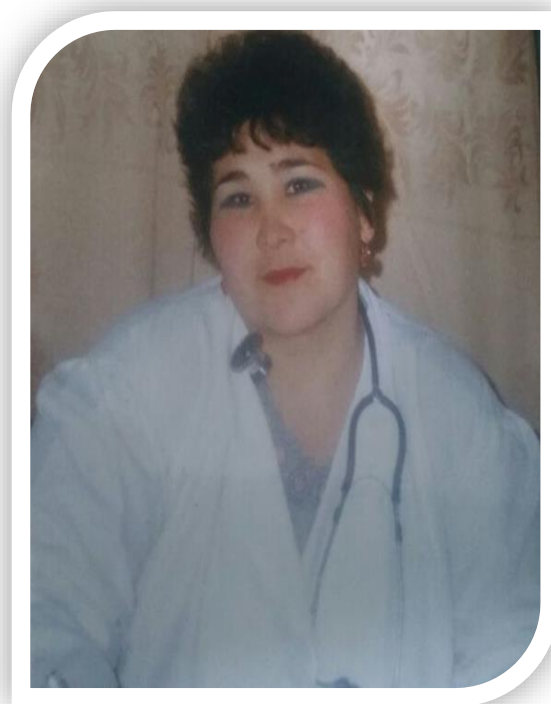
Арнайы пәндер циклының